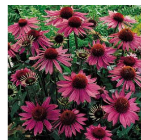
Échinacée pourpre 'Magnus'