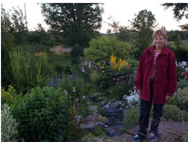
Le 9 août, visite du jardin La Roche Fleurie