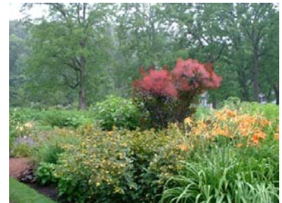
Le 31 juillet, voyage annuel au Domaine Joly de Lotbinière. Eh oui ! Il pleuvait à boire debout !