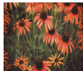
Échinacée 'Art's Pride'