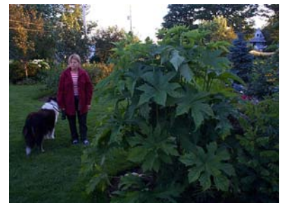
Ricin vivace, au jardin la Roche Fleurie