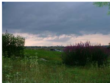
Le 16 août, visite du jardin Au Coeur du Tournesol